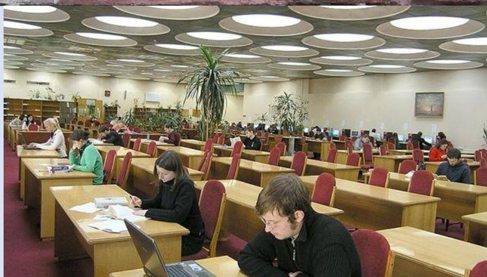
Національна бібліотека України ім. Вернадського