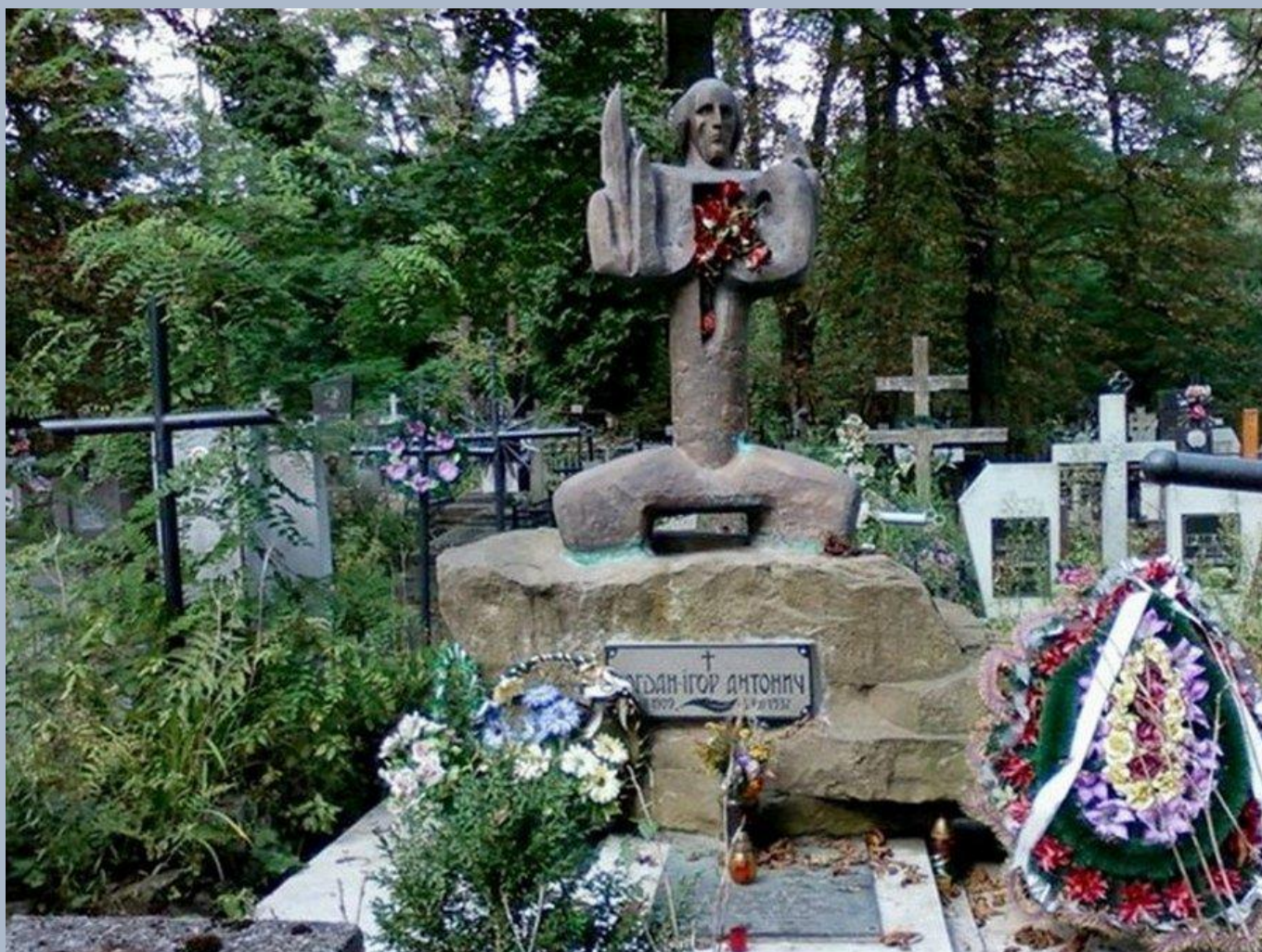
Могила Б.-І. Антонича у Львові на Янівському цвинтарі