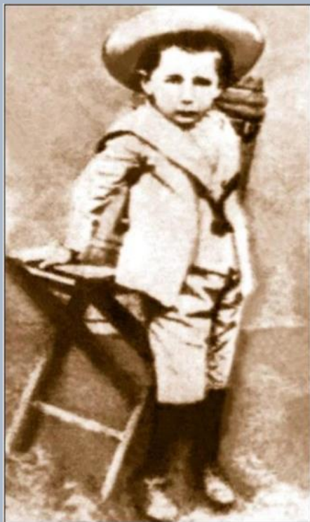
Б.-І. Антонич в дитинстві