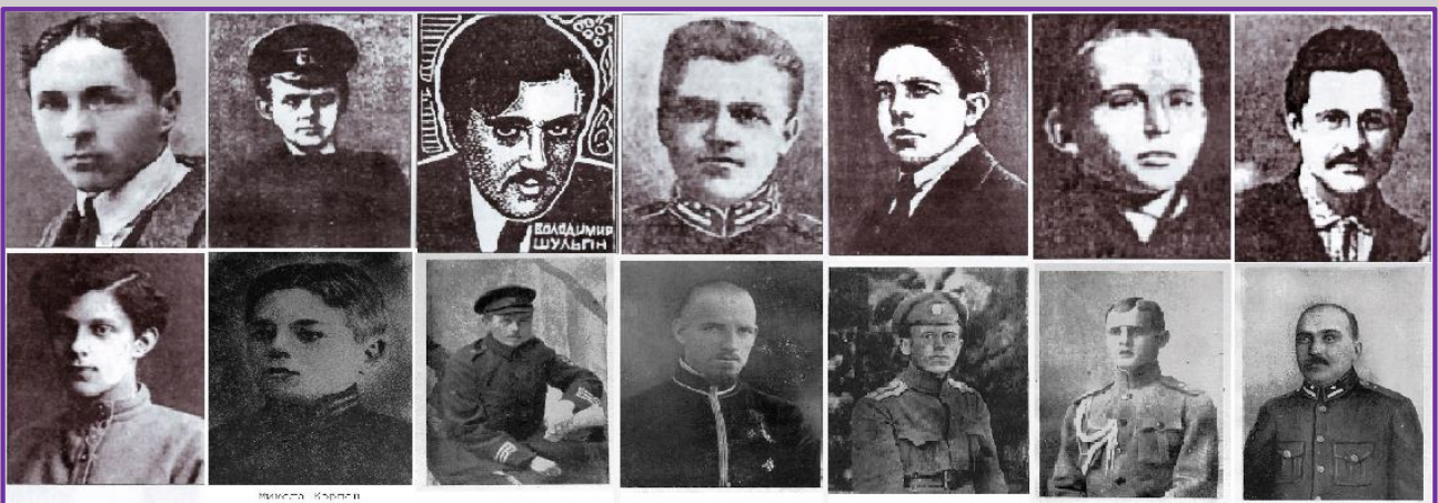
Фото загиблих Героїв Крут