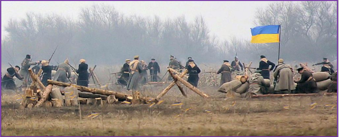
Сучасна реконструкція бою під Крутами